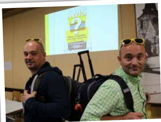
N-VA Asse organiseerde een "terug naar school kwis" volgend jaar zeker voor herhaling vatbaar !