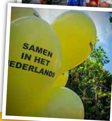
Ballonnenactie tijdens auto-loze zondag "Samen in het Nederlands", omdat het belangrijk is dat we elkaar verstaan!