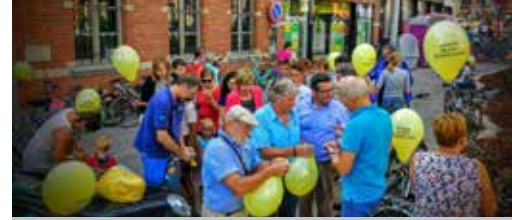
Ballonnenactie N-VA p. 3