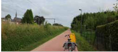
OMA-B-route opnieuw op agenda p. 2